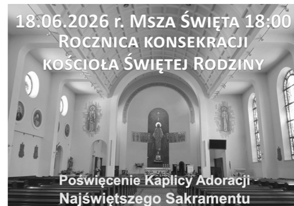
18.06.2026 r. MSZA ŚWIĘTA 18:00 ROCZNICA KONSEKRACJI KOŚCIOŁA ŚWIĘTEJ RODZINY

Niedawno świętowaliśmy uroczystość Najświętszego Ciała i Krwi Chrystusa. Tradycyjnie podczas procesji zatrzymywaliśmy się przy pięknie udekorowanych ołtarzach, by wysłuchać Słowa Bożego, które podkreślało jak wielkim darem dla nas ludzi jest obecność Jezusa w Eucharystii. Ostatni czwarty ołtarz zbudowany został przez rodziców dzieci pierwszokomunijnych przy krzyżu misyjnym. Przypominał nam o trwającym w Kościele roku Świętego Franciszka z Asyżu. Na ciemnym tle umieszczone zostało zdanie, które św. Franciszek usłyszał od Jezusa podczas modlitwy przed krzyżem w zniszczonym kościele San Damiano: Odbuduj mój kościół . Podobno zaraz po usłyszeniu tych słów Franciszek zabrał się za fizyczną pracę, by odbudować budynek. Podobnie wyremontował kaplicę: San Pietro i Matki Bożej Anielskiej (Porcjunkula) pod Asyżem.