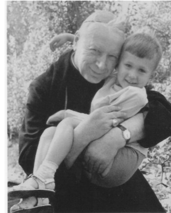
Stawał się jako dziecko, to brnąć z dziecięctwa to, co przystoi wiekowi dojeżdżalnemu: niepamięć zniewag, brak pożądań godności, miłość wspólnoty towarzyskiej, równowagę przyrodzoną, prostotę i szczerłość wobec Boga i ludzi. Kard. Stefan Wyszyński, 3 X 1954

Było to bardzo mylne wrażenie. Zawsze biła od Niego powaga, skupienie, a przede wszystkim wymowne dostojeństwo. Niezwykle ludzki, przyjazny i zawsze ojcowski. Dawało się to zauważyć między innymi podczas uroczystego wchodzenia do świątyni. Niektórzy ludzie na widok Księdza Prymasa ze szczęścia płakali i wyciągali ku Niemu swoje dłonie dziękując za Jego „Błogosławienie”. A przede wszystkim za zatrzymanie się przy matkach z dziećmi.